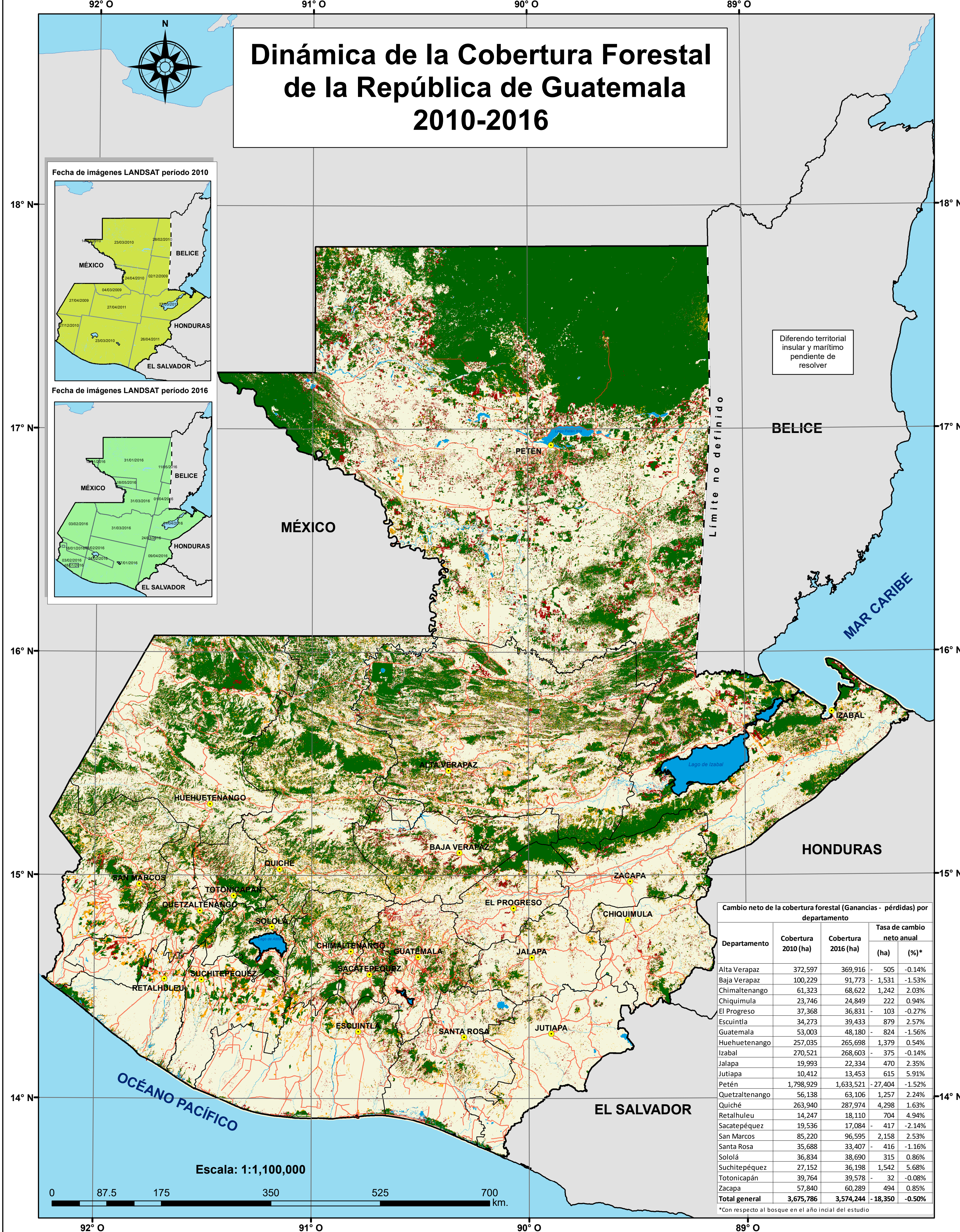
Fecha de imágenes LANDSAT periodo 2010

Puede circular, según resolución No.324-2019, INSTITUTO GEOGRÁFICO NACIONAL "Ingeniero Alfredo Obiols Gómez", exclusivamente para este tiraje 2,019. Este mapa fue elaborado por las instituciones arriba indicadas con información de la Base Cartográfica del INSTITUTO GEOGRÁFICO NACIONAL "Ingeniero Alfredo Obiols Gómez". Derechos de propiedad reservados, prohibida su reproducción 14 de enero 1,959.